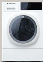
Stellaria Snow AAA0.100