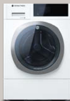
Serenity Snow AAA1.101